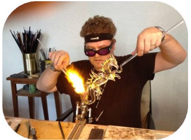
Artisan en verrerie d'art à l'œuvre

Potiers, peintres, sculpteurs et comédiens sont quelques exemples de professions d'art.